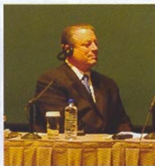
Ο Αλ Γκορ κατά τη συνέντευξη τύπου στο Μέγαρο Μουσικής.

Πράγματι, με την ομιλία του κ. Γκορ στην Αθήνα, η ECOWEEK, κατά κάποιο τρόπο, ξεπέρασε τα όριά της. Όμως έχουμε ακόμη πολύ δρόμο μπροστά μας. Ήδη ξεκι-