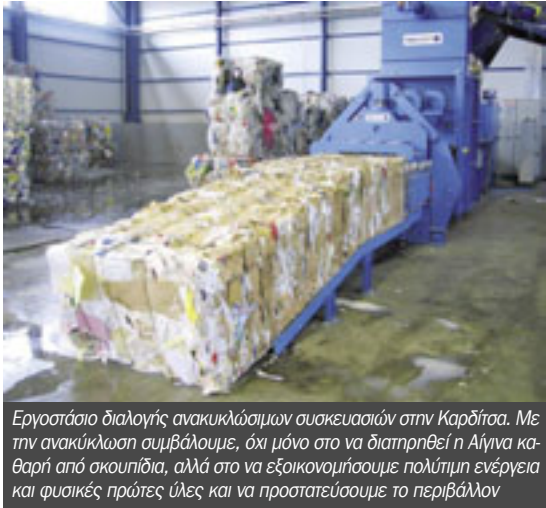
Εργαστήριο διαλογής ανακυκλώσιμων συσκευασιών στην Καρδίτσα. Με την ανακύκλωση συμβάλουμε, όχι μόνο στο να διατηρηθεί η Αίγινα καθαρή από σκουπίδια, αλλά στο να εξοικονομήσουμε πολύτιμη ενέργεια και φυσικές πρώτες ύλες και να προστατεύσουμε το περιβάλλον

Θα έμοιαζε σαν όνειρο, πριν από δύο χρόνια να πω ότι ξεκινάει η ανακύκλωση στην Αίγινα. Τότε ξεκινούσαν τα πρώτα βήματα και οι πρώτες ενέργειες για την εναλλακτική διαχείριση των απορριμμάτων του νησιού.