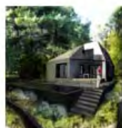
paan architects www.paan.gr