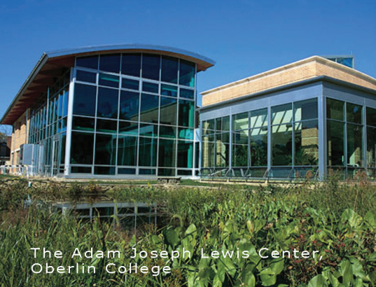
The Adam Joseph Lewis Center Oberlin College