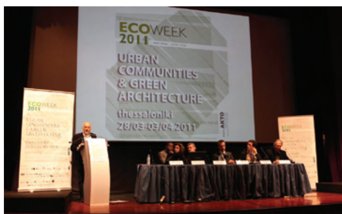
Συνέντευξη τύπου της ECOWEEK 2011 στο Ολύμπιο στη Θεσσαλονίκη.

Με σκοπό να δημιουργήσει μια κοινότητα νέων 'πράσινων' μηχανικών, η ECOWEEK έχει δημιουργήσει το νέο ιστοχώρο για τους 'απόφοιτους' και συμμετέχοντες στα εργαστήρια σχεδιασμού της ECOWEEK όπου προωθείται η συνεργασία, η δικτύωση και η προβολή των νέων επαγγελματιών. Η διεύθυνση είναι www.ecoweek.net Περισσότερες πληροφορίες για τη δραστηριότητα της ECOWEEK στην ιστοσελίδα www.ecoweek.org ■